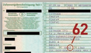
Einstufung Partikelminderung in den neuen Zulassungsbescheinigungen, ausgestellt ab 01.10.2005